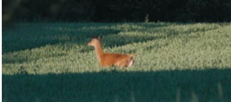
Kronvildt kan gøre betragtelig skade på land- og skovbrug.

meget attraktiv og populær for danske jægere. Tilsvarende er risikoen for en for hårdhændet, ukoordineret og ikke bæredygtig afskydning af hjorte på relativt små terræner steget. For at modvirke denne udvikling anbefaler de etiske regler for kronvildtjagt, at sikre ro i brunstperioden.