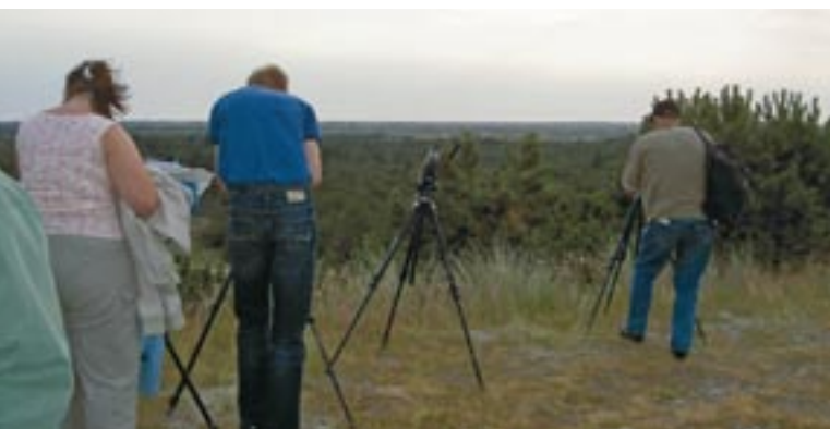
Andre naturbrugere end jægere nyder også oplevelser med kronvildt - selv på lang afstand.