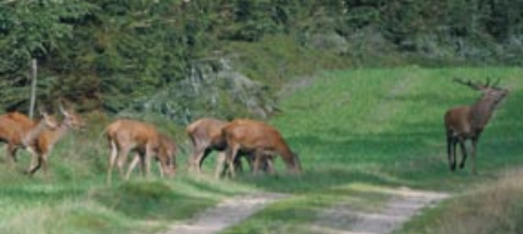
Det er vigtigt at sikre kronvildtet ro i brunsten.