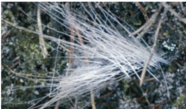
Det kan være meget vanskeligt at konstatere om dyret er ramt. Brug derfor altid de registrerede schweishunde.

I tilfælde af anskydning skal den enkelte jæger sørge for, at der iværksættes en forsvarlig eftersøgning. De etiske regler for kronvildtjagt påpeger følgende: Vær opmærksom på skudtegn og skyd ikke til uskadede dyr, hvis du på samme post allerede har skudt til dyr, der ikke ligger synligt forendt. Det anbefales, at der kun bruges registrerede schweishunde til eftersøgning.