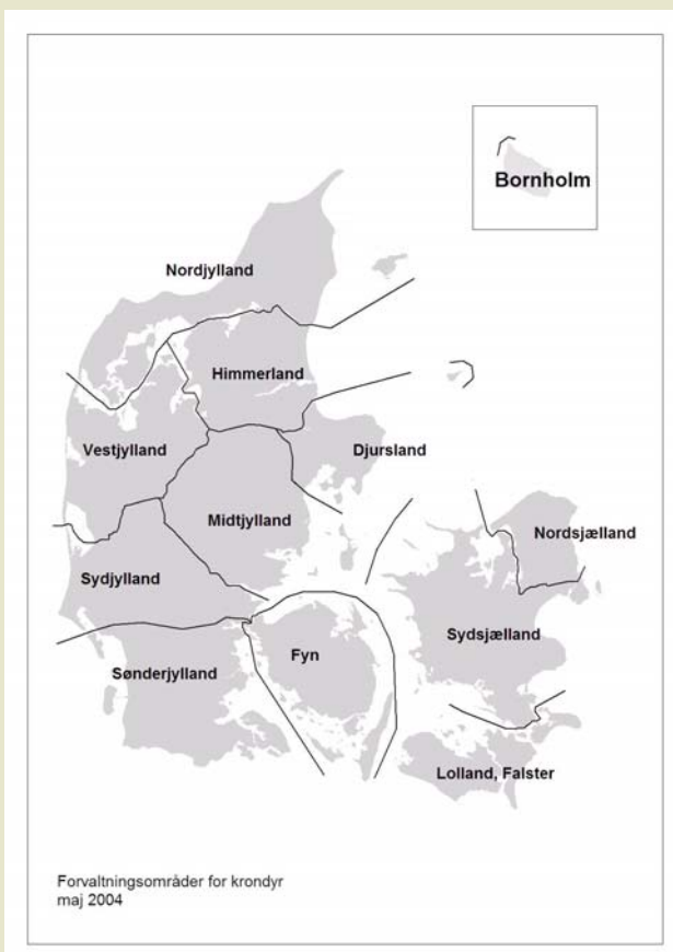
Figur: Kronvildtregionernes geografiske udstrækning.

Debatten har blandt andet medført oprettelse af regionale kronvildtgrupper, der skal medvirke til en bæredygtig forvaltning af kronvildtbestanden. Kronvildtgrupperne muliggør regionale forvaltningsmodeller og er et godt eksempel på et bredt samarbejde mellem vildtets forskellige interesseparter på både lokalt såvel som nationalt niveau.